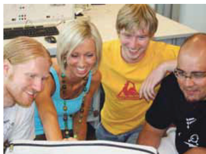
Eine Firmengründung bedeutet vor allem harte Arbeit.

Noch nie wurden in der Schweiz so viele Firmen gegründet wie 2010. Die Fragen, die sich vor einer Firmengründung stellen, sind meist dieselben: Woher kommt die Kohle? Wie wird ein Businessplan erstellt? Wo können günstige Büroräume gemietet werden? Eine mehrteilige Veranstaltungsreihe gibt Antworten auf diese und andere brennende Fragen. Am 5. April 2011 werden viele Aspekte und Fragen rund um die Infrastruktur, die praktischen Seiten einer Firmengründung sowie die IT-Umgebung von Startups betrachtet. Am 6. Juni 2011 findet Teil 3 statt. Dieser Teil bietet künftigen Unternehmern hilfreiche Infos und wichtige Kontakte an. Auch wird Detailwissen rund um die Geldbeschaffung vermittelt. www.gryps.ch www.xing.ch